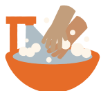
Lavagem com água e sabão

A forma mais simples e efetiva de evitar a transmissão de infecções em ambiente hospitalar é a higienização de mãos .